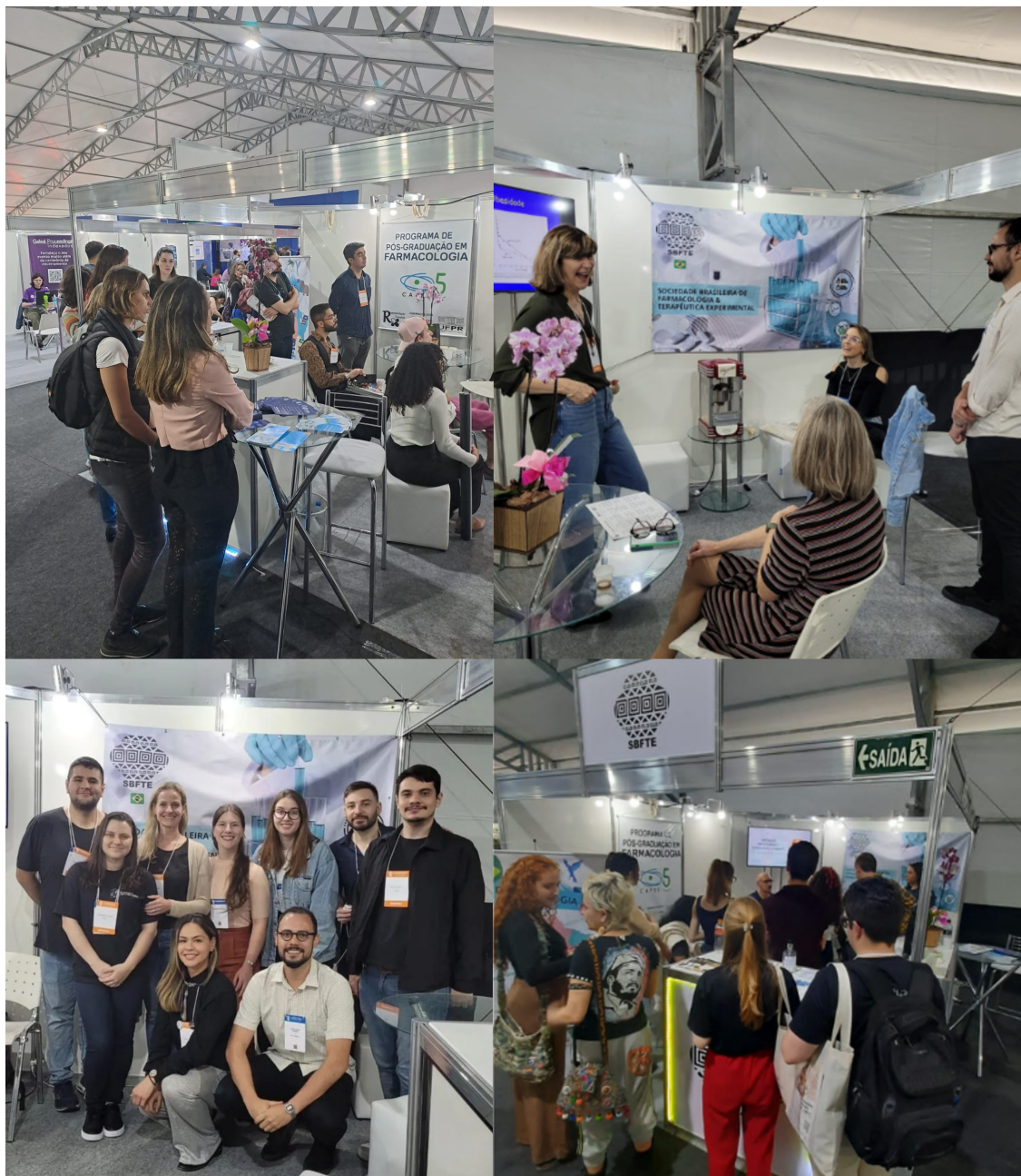
Figura 3: Atividades na ExpoT&C-SBPC onde o INCT-INO FAR apresentou a Quimioteca do LASSBio e seu material de Divulgação Científica.

O folder de divulgação do material lúdico-pedagógico do INCT-INO FAR atraiu a atenção de professores do ensino básico e médio, além de professores do ensino superior com interesse em popularização da Ciência. A partir deste folder , os visitantes foram orientados a baixar os gibis, cartilhas e jogos através do site do