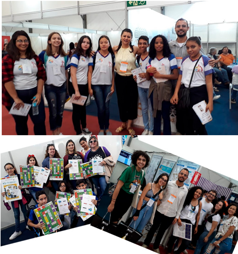
Figura 9: Participantes de escolas de ensino fundamental e médio aprenderam sobre o tema “Uso Racional de Medicamentos” através do material elaborado pelo INCT-INOFAR e da orientação de sua equipe.

ao “Uso Racional de Medicamentos”. Em meio a muita euforia, os jovens acabaram se rendendo ao assunto e passaram a interagir com perguntas bem interessantes.