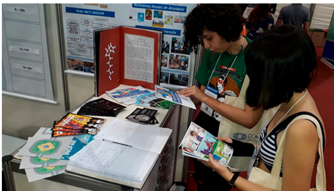
Figura 3: Participantes da 71ª Reunião Anual da SBPC conhecendo o material levado pelo INCT-INOFAR.

Focada em orientar quanto ao tema “Uso Racional de Medicamentos”, a equipe do INCT-INOFAR , teve uma média de 120 visitantes/dia. Enquanto alguns participantes eram atraídos pela oportunidade de esclarecer dúvidas sobre a ação dos fármacos e as etapas do seu processo de desenvolvimento, outros buscavam o material informativo levado pelo INCT-INOFAR , que torna o “Uso Racional de Medicamentos” de fácil entendimento e rápida assimilação. O gibi "A Turma do Zequinha em: Uso Correto dos Anti-inflamatórios" é um exemplo que esclarece de maneira lúdica e interessante os riscos do uso indiscriminado desses medicamentos.