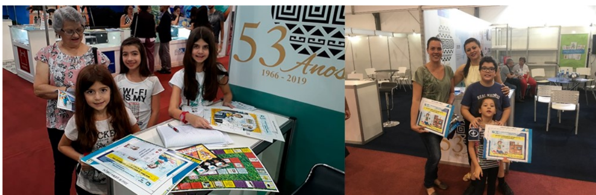
Figura 8: Participantes de diversas faixas etárias puderam aprender sobre fármacos e medicamentos através do material utilizado pelo INCT-INOFAR na 71 a Reunião Anual da SBPC.

Em seu penúltimo dia de atividades (26/07), a 71 a Reunião Anual da SBPC recebeu um volume ainda maior de visitantes, se comparado aos dias anteriores. Pode-se constatar a presença, em número bem maior, de grupos escolares advindos de várias regiões sul-mato-grossenses. Graças a isso, o desenvolvimento das atividades voltadas para o público mais jovem pode ser bastante explorado, gerando uma atmosfera de grande aprendizado!