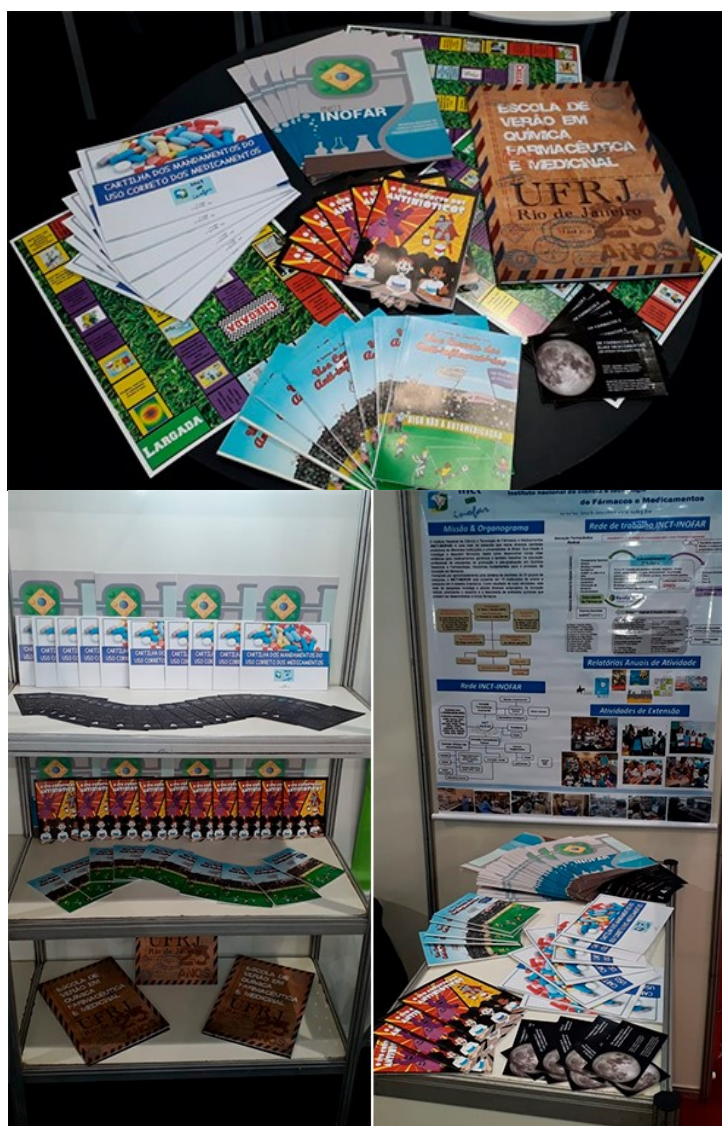
Figura 2: Material utilizado pelo INCT-INOFAR para divulgação e popularização da ciência

O INCT-INOFAR , que desenvolve de forma pioneira atividades de Divulgação Científica e Popularização da Ciência levou, mais uma vez, sua pasta portfólio, contendo material lúdico-pedagógico como gibis, cartilhas e jogos, além dos vídeos animados das suas cartilhas educativas.