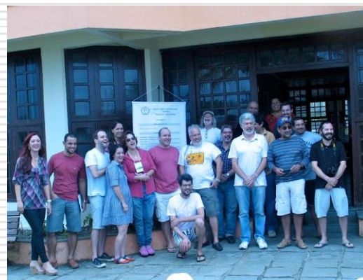
I ESCOLA TEMÁTICA DE DIVULGAÇÃO CIENTÍFICA 15+