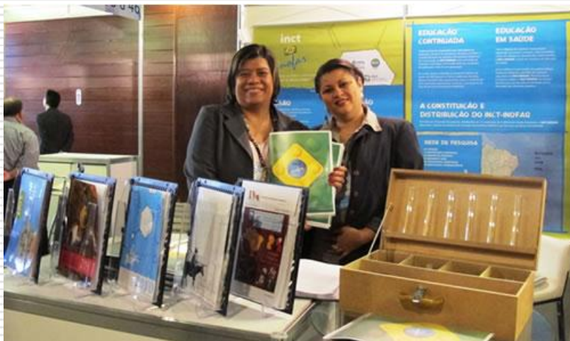
Reunião de Avaliação dos INCT's Julho 2013

Operar e colaborar com a Secretaria de Extensão no planejamento e organização das atividades de divulgação e popularização da Ciência e Educação em Saúde.